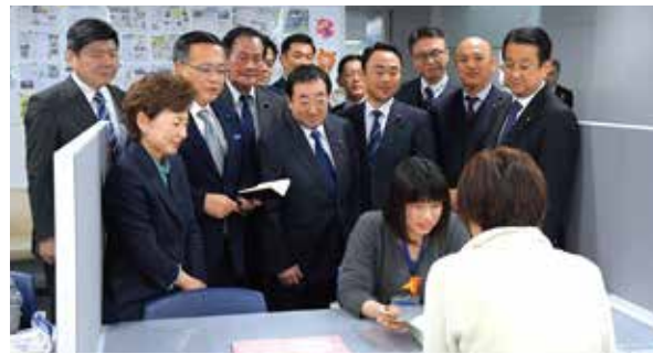
母子保健コーディネーターによる相談支援を視察

母子保健コーディネーターを全区配置! 公明党市議員団は、妊娠前から子育て期における切れ目のない支援を図る、「子育て世代包括支援センター」の機能充実を訴えて参りました。 その中でも、母子健康手帳交付時の面接・相談や、個々の状況に適した情報提供等を実施し、産前産後の支援の充実を図る母子保健コーディネーターの配置拡充を要望していましたが、令和2年度予算案に新規7区含む全18区への配置を盛り込むことができました。