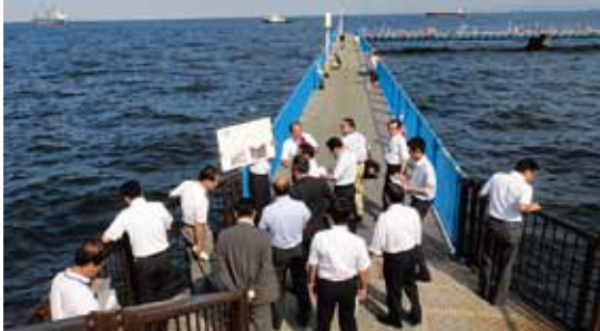
港湾施設を視察(8月9日)

横浜港の235ある岸壁や護岸といった主な港湾施設のうち、建造後50年以上経過しているものは現在48施設、2032年時点では半数近い115施設に上ります。 公明党横浜市議員団は、こうした港湾施設における老朽化等の状況を把握するため横浜港を調査し、市内経済の要であり、災害時にも輸送の重要な経路となる港湾施設の耐震化、防災対策及び長寿命化を計画的に進めるよう平成25年度予算要望で市長に申し入れました。