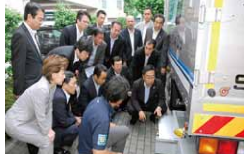
地中空洞探査車両を視察(6月2日)

輸送路をつなぐ道路の調査を始めると、空洞が発見された場合は、速やかに補修などの対応を行う旨の答弁がありました。