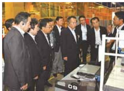
医薬品用物流拠点を視察(8月27日)