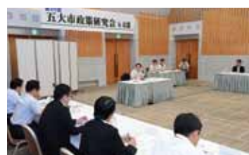
公明党横浜市議団の代表と意見交換(8月16日)

大都市共通の政策課題を議論する公明党の「五大市政研究会」(横浜・名古屋・京都・大阪・神戸)でも、各都市の取り組み状況について報告し合いました。市内緊急輸送路の空洞調査を市長に提案した横浜市の取り組みや、公共土木施設を長寿命化することで、今後50年の整備費をおおよそ半減できるとする名古屋市の予防保全計画の実例などが注目を集めました。また、レベニュー債など民間企業の活力を生かした財源調達についても議論しました。