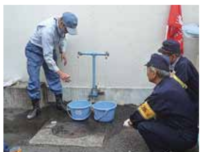
三ツ境小学校での訓練(10月20日)

そのため172カ所の小中学校に設置されている受水槽や屋上の高置槽を活用し、さらに防災訓練に学校受水槽等からの応急給水訓練の実施を盛り込むよう提案しました。今後各区での展開が検討されます。