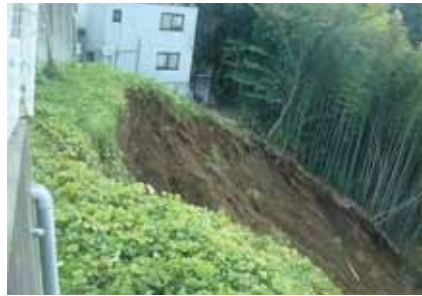
市内で発生したがけ崩れの様子

市内約9800か所の崖地について、平成26年度から29年度までの4か年で、現地調査を行っています。この度の一般会計の増額補正により、28年度実施予定の一部について前倒して調査を行うこととなり、当初29年度末の調査終了想定が約半年早まります。 避難勧告対象区域の更新については、各区の調査終了時に随時実施しており、地質の専門家による調査結果を基に、がけ崩れが発生した場合に人家に著しい被害を及ぼす可能性がある崖地を抽出し、その周辺を即時勧告の対象区域としています。