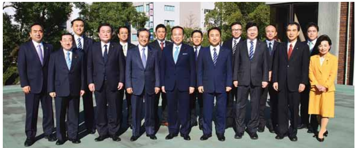
予算議会論戦に臨む公明党市議員団

公明党横浜市議員団がリードしてきた小児医療費助成の拡充に関して、このほど発表された平成28年度予算案には、29年4月より対象年齢を拡大する方向性が示されました。本市では昨年10月に助成対象を小学1年生から小学3年生に拡大したばかりですが、29年4月の拡充に向けた関連経費が予算案に盛り込まれました。 公明党市議員団は、中学3年生までの対象年齢の拡大及び所得制限の撤廃を求めています。29年4月の拡充についてはまずは小学6年生までの拡大を目指します。 横浜市における小学3年生までの助成対象者数は約24万人で28年度予算案の事業費は約91億円です。小学6年生まで拡大した場合は助成対象者数が約6万人増加し、年間事業費は約15億円増の見込みです。29年4月からの拡充に向け、28年度はシステム改修などの準備経費約7千万円を盛り込む予定です。