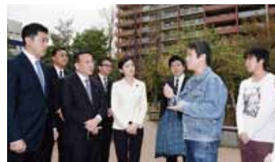
マンションを視察する公明党議員団

都筑区の大型マンション傾斜問題については報道直後、公明党市議団として、佐々木さやか参院議員、三浦のぶひろ青年局長らとともに現地を視察。住民の声を受け、横浜市建築局と意見交換を行い、住民の「心のケア」などきめ細かい相談体制を確立する必要性を指摘しました。その結果、横浜市として、くい工事問題に関する対策会議を設置し、都筑区マンション住民の支援を行うとともに、他の公共施設等の安全性の確認を行っています。