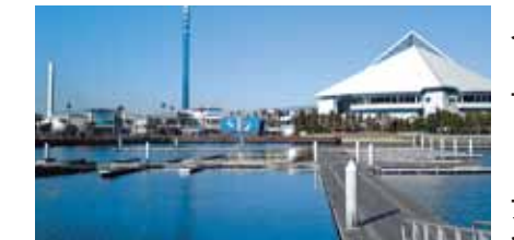
八景島シーパラダイス