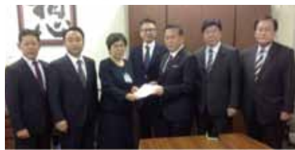
再編整備計画へ申し入れをする公明党市議団表がありました。閉校については、転校が困難な児童生徒が出る等、多くのご意見もいただいております。閉校による多大なる影響が考えられます。このようなことを踏まえ、公明党市議団として、北綱島特別支援学校については、左近山特別支援学校の開校に合わせて閉校するのではなく、児童生徒の個々の状況や、保護者の皆様のご意見やご要望を踏まえ、抜本的かつ柔軟に再検討するよう申し入れを行いました。

平成31年度に新たに旭区に「左近山特別支援学校」を開校しますが、それに伴い港北区の「北綱島特別支援学校」を閉校するとの発表がありました。閉校については、転校が困難な児童生徒が出る等、多くのご意見もいただいております。このようなことを踏まえ、公明党市議団として、北綱島特別支援学校については、左近山特別支援学校の開校に合わせて閉校するのではなく、児童生徒の個々の状況や、保護者の皆様のご意見やご要望を踏まえ、抜本的かつ柔軟に再検討するよう申し入れを行いました。