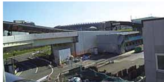
平成28年度に完成する横浜環状北線

都市の骨格となる横浜環状道路や相鉄・JR・東急線と結ぶ神奈川東部方面線の整備等を通じて、交通ネットワークの充実による都市インフラを強化します。