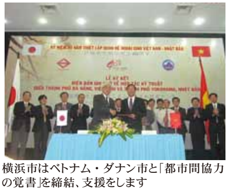
横浜市はベトナム・ダナン市と「都市間協力の覚書」を締結、支援をします