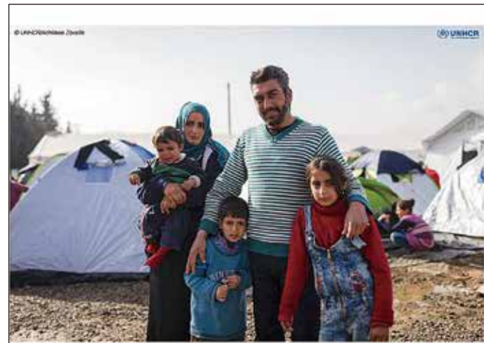
UNHCR Greece. Thousands of refugees mainly from Iraq and Syria are stranded at the village of Idomeni near the Greek - FYR of Macedonia border.

国による外交活動だけでなく、地域や市民による平和への活動や国際交流、国際協力、多文化共生などの取組が、世界の平和と安定に貢献します。横浜市そして横浜市民が培ってきた国際平和推進の取組を次の世代へ確かなものとするために条例を提案するものです。市民意見募集後、いただいたご意見を反映した条例案として5月から始まる横浜市会第2回定例会での成立を目指しています。