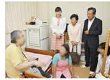
訪問介護の現場にて

新たな地域づくりへ、地域のニーズを的確に把握し、経験、実績、ネットワーク力のある公明党が、皆で支え合う社会づくりをリードしていきます。