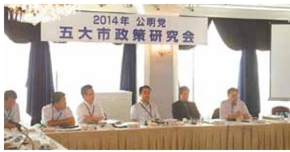
2014年 公明党 五大市政策研究会

団塊の世代が75歳以上となる2025年には、医療と介護の需要が急激に増加することが確実です。住み慣れた地域で医療、介護、予防、住まい、生活支援サービスを切れ目なく利用できる「地域包括ケアシステム」。一段と進む高齢化に備え、公明党は推進本部を設置し、他党に先駆け、実態把握や地方議員との意見交換などを重ねてきました。