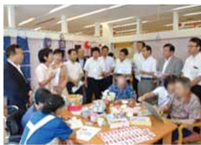
認知症対応施設の視察

2025年を見据え「地域包括ケア計画」を策定し、生涯現役社会の実現に向けた高齢者の活躍できる地域づくりと、住み慣れた地域で自立した日常生活を営むことができる横浜型地域包括ケアシステムを展開します。