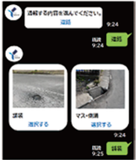
通報システム画面(イメージ)

市民の皆様が、スマートフォンから簡単な操作で、道路の破損をいつでも通報できるようにします。LINEの横浜市公式アカウントから、舗装の穴やカーブミラーの不具合等を選択式で入力、写真や地図も添付でき簡易に通報できるものです。一昨年から提案していたものですが、この4月中に利用が開始されます。