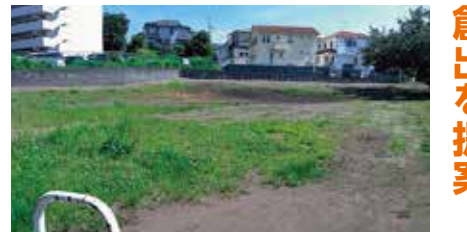
サムエル広場の半分を緑地整備

鶴見区内で昨年廃止が検討された「サムエル広場」について、地域からの声を受け広場の維持を要望していました。その結果、敷地の約半分を売却し、広場として活用していたエリアは横浜みどりアップ事業で緑地として整備されることになりました。そこで緑の少ない市街地において、こうした横浜みどり税の活用による緑の創出を一層進めていくべきと指摘しました。