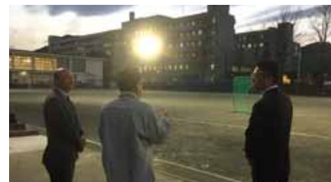
市立城北小学校での照明設置状況等を確認

横浜市は、夜間照明の設置は4.5%にあたる22校にとどまっています。市議団は、オリンピック・パラリンピック東京大会を契機とした地域スポーツのレガシー遺産として、夜間照明の設置推進に取組みます。(4月12日)