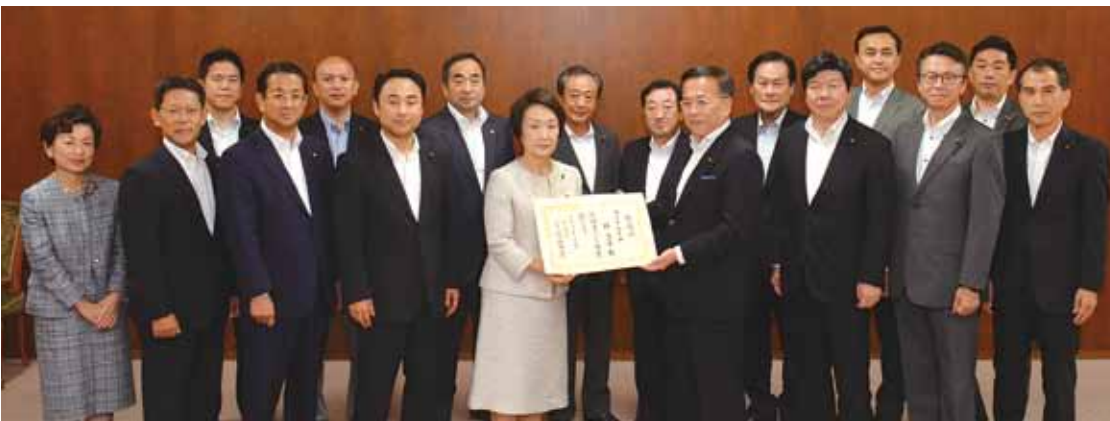
林文子市長に推薦状を手渡す公明党市議員